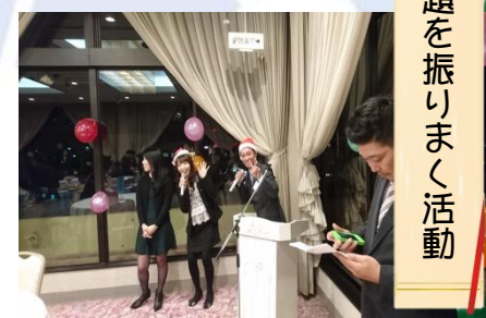
地域に明るい話題を振りまく活動