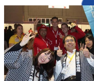
地元の人との繋がりが地域を超えて広がる輪