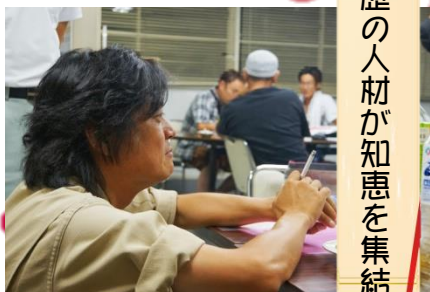
様々な業種経験の人材が知恵を集結